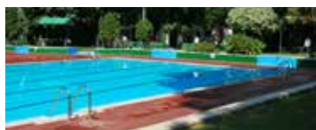
Piscina de verano O'Donnell