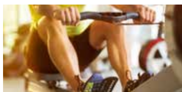
Sala fitness y musculación