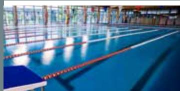
Piscinas deportiva y de enseñanza