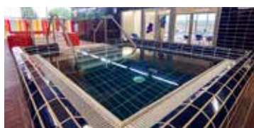
Área de spa, sauna y baño turco