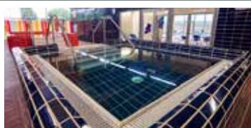
Área de spa, sauna y baño turco