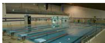
Piscina cubierta Val

En piscinas cubiertas, consultar horarios de uso libre en el folleto informativo correspondiente o en la web: www.oacdmalcala.org