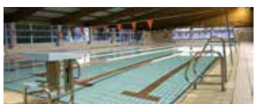
Piscina cubierta Juncal

En piscinas cubiertas, consultar horarios de uso libre en el folleto informativo correspondiente o en la web: www.oacdmalcala.org