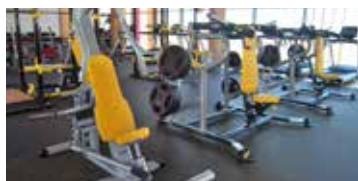
Sala fitness y musculación