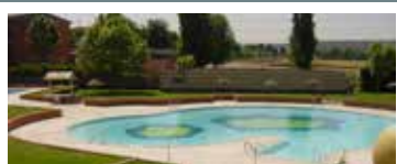
Piscina de verano Juncal