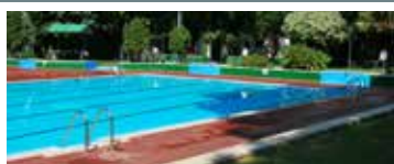
Piscina de verano O'Donnell