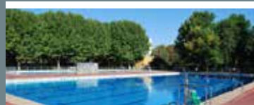
Piscina de verano Val